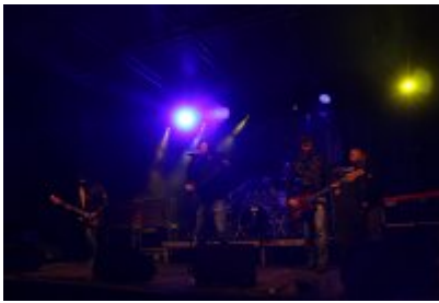
• 25. Finał WOŚP