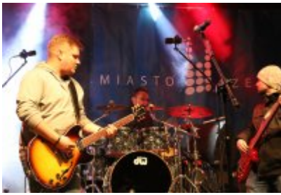
• 25. Finał WOŚP