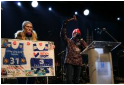
• 25. Finał WOŚP