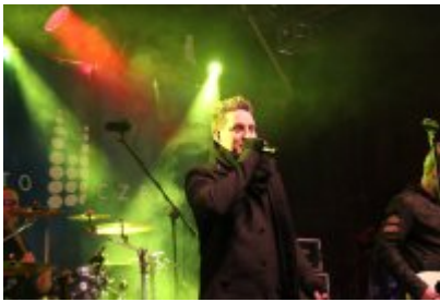
• 25. Finał WOŚP