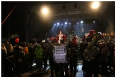
• 25. Finał WOŚP