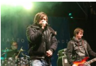
• 25. Finał WOŚP