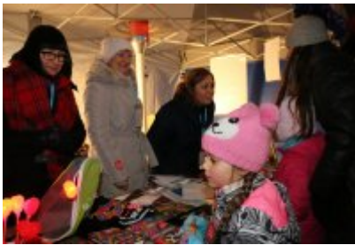
• 25. Finał WOŚP