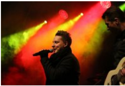
• 25. Finał WOŚP