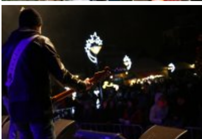
• 25. Finał WOŚP