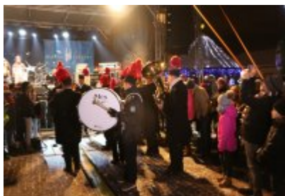
• 25. Finał WOŚP