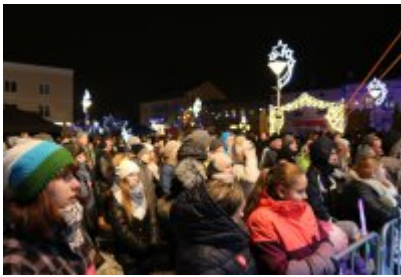
• 25. Finał WOŚP