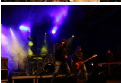
• 25. Finał WOŚP