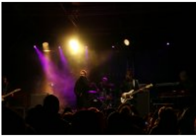
• 25. Finał WOŚP