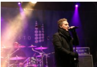
• 25. Finał WOŚP