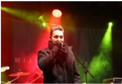
• 25. Finał WOŚP