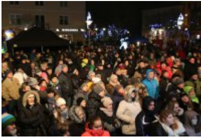
• 25. Finał WOŚP