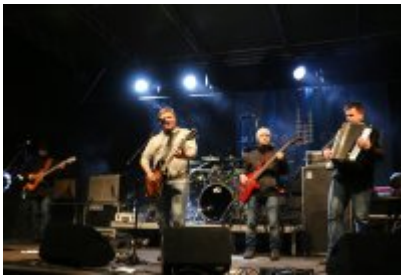
• 25. Finał WOŚP