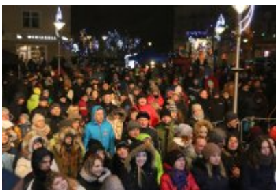
• 25. Finał WOŚP