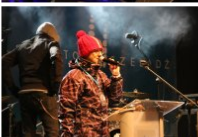
• 25. Finał WOŚP