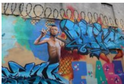
XII Graffiti Jam