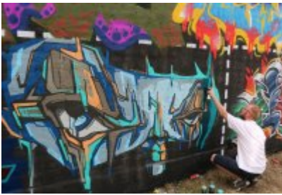
• XII Graffiti Jam