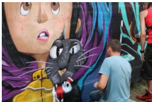
XII Graffiti Jam w Czeladzi

W sobotę, 1 lipca blisko 90 uczestników XII Graffiti Jam ozdobiło otoczenie Szkoły Podstawowej nr 1, przy ul. Reymonta.