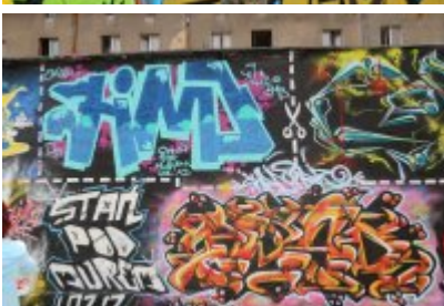
• XII Graffiti Jam