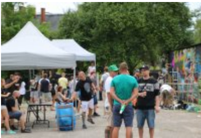
• XII Graffiti Jam