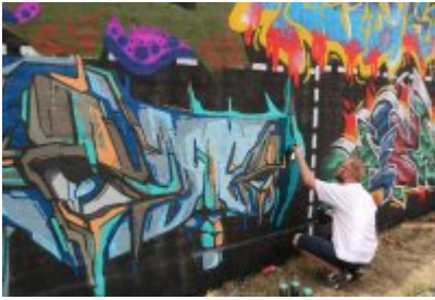
• XII Graffiti Jam