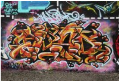
• XII Graffiti Jam