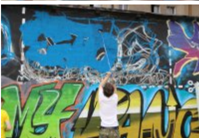
• XII Graffiti Jam