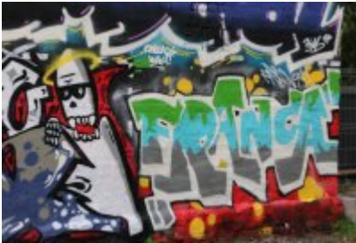
• XII Graffiti Jam