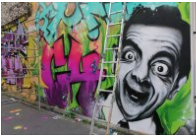
• XII Graffiti Jam