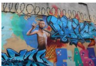
XII Graffiti Jam