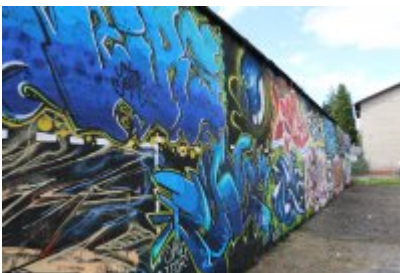
• XII Graffiti Jam