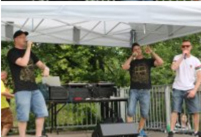
• XII Graffiti Jam