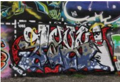
• XII Graffiti Jam