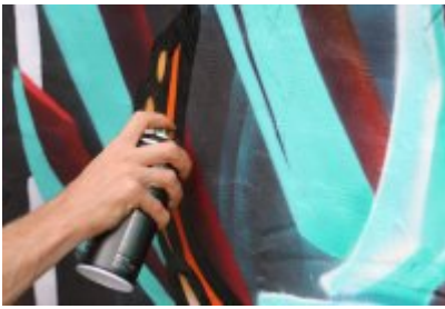
• XII Graffiti Jam