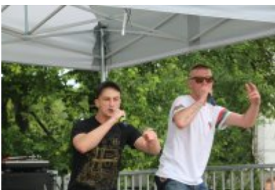
• XII Graffiti Jam