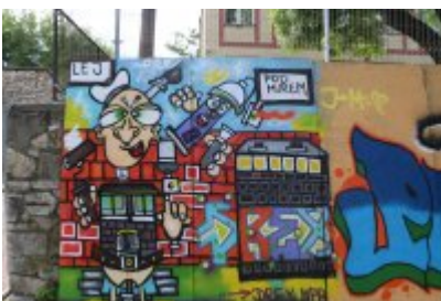
• XII Graffiti Jam