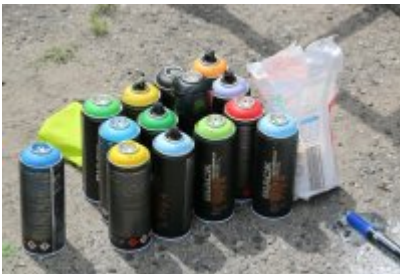
• XII Graffiti Jam