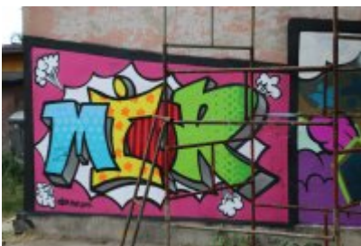
• XII Graffiti Jam