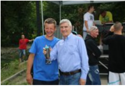
• XII Graffiti Jam