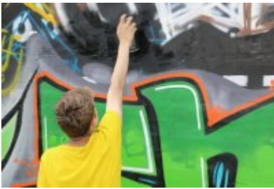
• XII Graffiti Jam