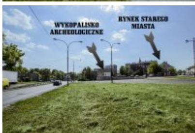
Niezwykłe odkrycie archeologiczne w Czeladzi