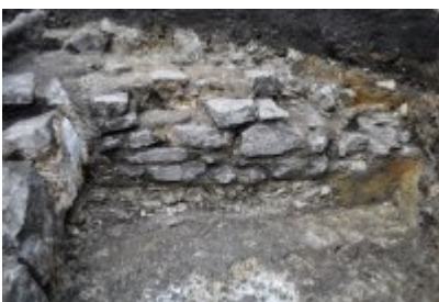
• Niezwykłe odkrycie archeologiczne w Czeladzi