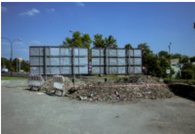
• Niezwykłe odkrycie archeologiczne w Czeladzi