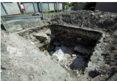
• Niezwykłe odkrycie archeologiczne w Czeladzi