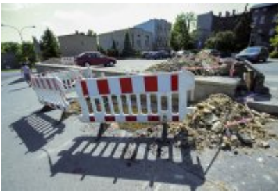
• Niezwykłe odkrycie archeologiczne w Czeladzi