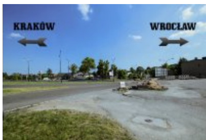
Niezwykłe odkrycie archeologiczne w Czeladzi