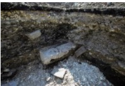
• Niezwykłe odkrycie archeologiczne w Czeladzi