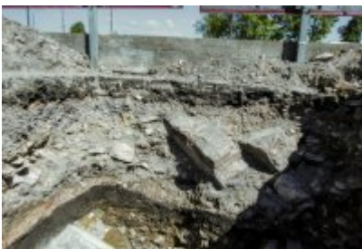
• Niezwykłe odkrycie archeologiczne w Czeladzi