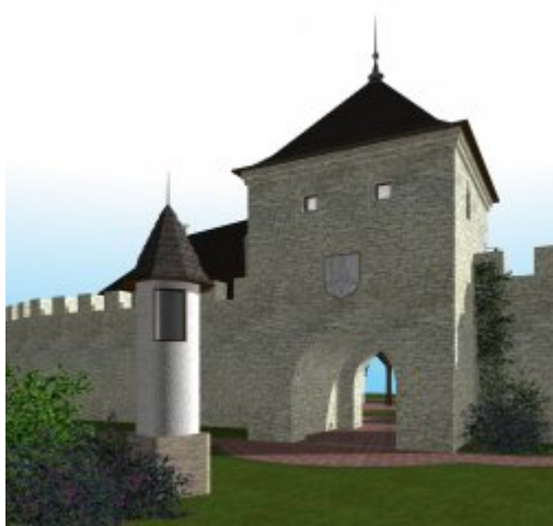
Wizualizacja bramy krakowskiej