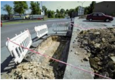
• Niezwykłe odkrycie archeologiczne w Czeladzi