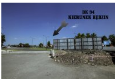
Niezwykłe odkrycie archeologiczne w Czeladzi