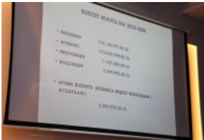
• Sesja Rady Miejskiej w Czeladzi (20.12.2022)