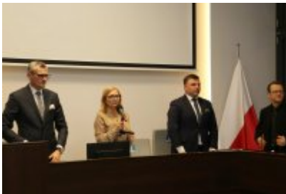
• Sesja Rady Miejskiej w Czeladzi (20.12.2022)