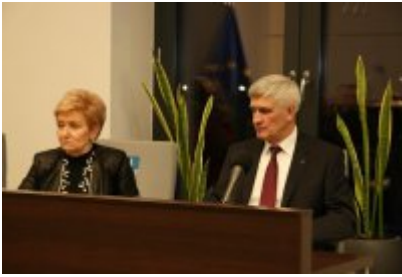
• Sesja Rady Miejskiej w Czeladzi (20.12.2022)