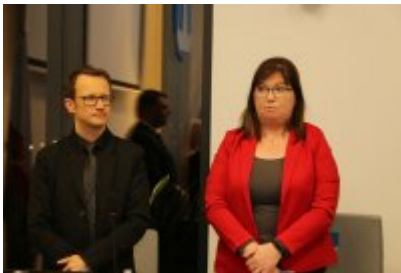
• Sesja Rady Miejskiej w Czeladzi (20.12.2022)