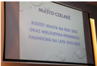
• Sesja Rady Miejskiej w Czeladzi (20.12.2022)