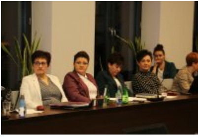
• Sesja Rady Miejskiej w Czeladzi (20.12.2022)