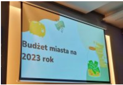
• Sesja Rady Miejskiej w Czeladzi (20.12.2022)