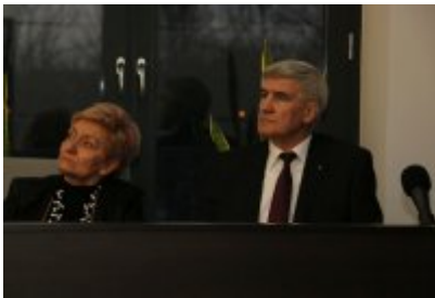
• Sesja Rady Miejskiej w Czeladzi (20.12.2022)