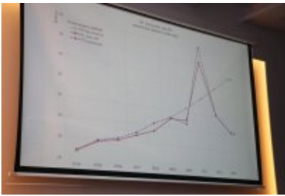
• Sesja Rady Miejskiej w Czeladzi (20.12.2022)