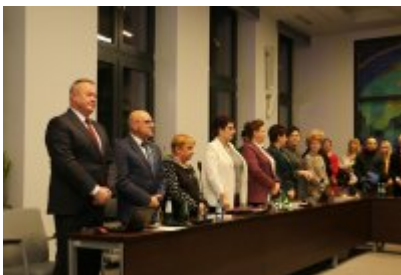
• Sesja Rady Miejskiej w Czeladzi (20.12.2022)