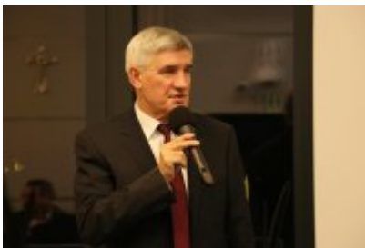
• Sesja Rady Miejskiej w Czeladzi (20.12.2022)