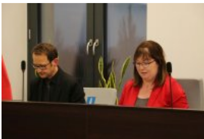
• Sesja Rady Miejskiej w Czeladzi (20.12.2022)