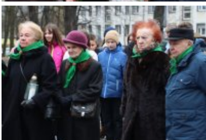
• 79. rocznica powrotu Dzieci Potulic