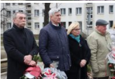
• 79. rocznica powrotu Dzieci Potulic