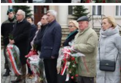
• 79. rocznica powrotu Dzieci Potulic