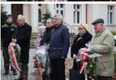
• 79. rocznica powrotu Dzieci Potulic