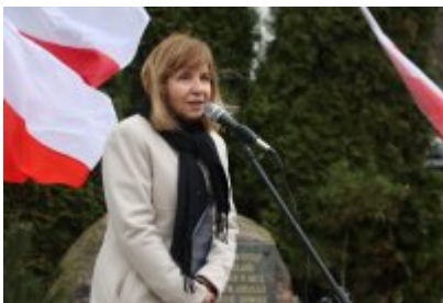
• 79. rocznica powrotu Dzieci Potulic