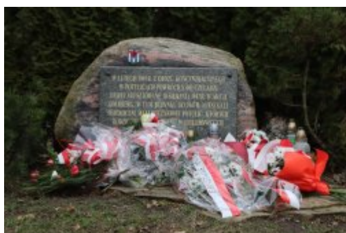
79. rocznica powrotu Dzieci Potulic

19 lutego o godz. 12.00 przed obeliskiem poświęconym pamięci Dzieci Potulic usytuowanym nieopodal siedziby Muzeum Saturn odbyły się uroczystości 79. rocznicy powrotu czeladzkich dzieci z niemieckiego obozu w Potulicach.