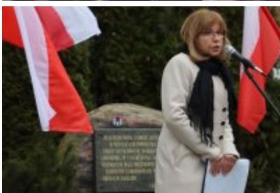
• 79. rocznica powrotu Dzieci Potulic