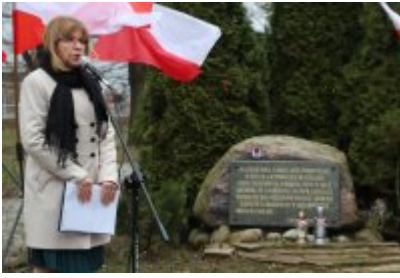
• 79. rocznica powrotu Dzieci Potulic