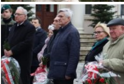
• 79. rocznica powrotu Dzieci Potulic