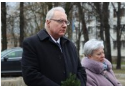
• 79. rocznica powrotu Dzieci Potulic