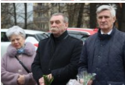
• 79. rocznica powrotu Dzieci Potulic