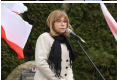
• 79. rocznica powrotu Dzieci Potulic