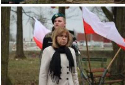
• 79. rocznica powrotu Dzieci Potulic