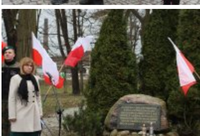
• 79. rocznica powrotu Dzieci Potulic