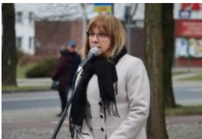
• 79. rocznica powrotu Dzieci Potulic