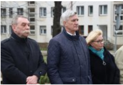
• 79. rocznica powrotu Dzieci Potulic