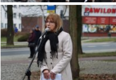
• 79. rocznica powrotu Dzieci Potulic