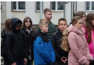
• 79. rocznica powrotu Dzieci Potulic