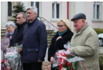
• 79. rocznica powrotu Dzieci Potulic