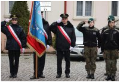
• 79. rocznica powrotu Dzieci Potulic