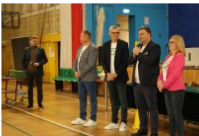
• III Czeladzka Olimpiada Seniorów