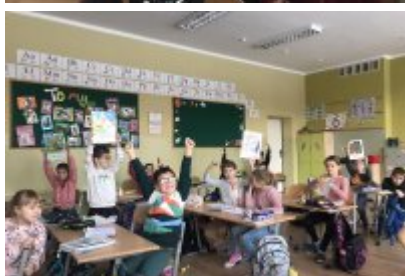
Zajęcia ekodoradcy w SP5