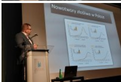
Czeladzkie Spotkania Medyczne (9.11.2023)