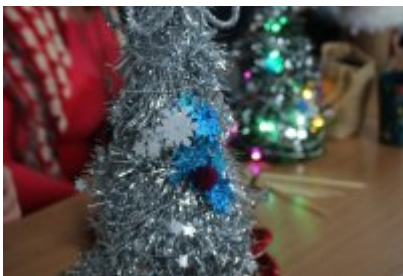
• Świąteczne warsztaty rękodzieła (28.11.2023)