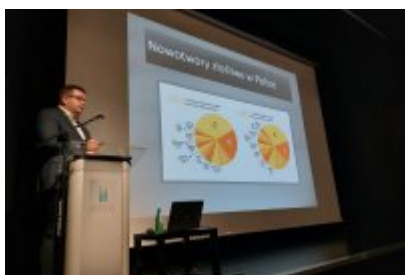
Czeladzkie Spotkania Medyczne (9.11.2023)