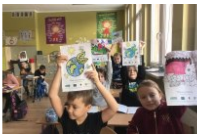
Zajęcia ekodoradcy w SP5