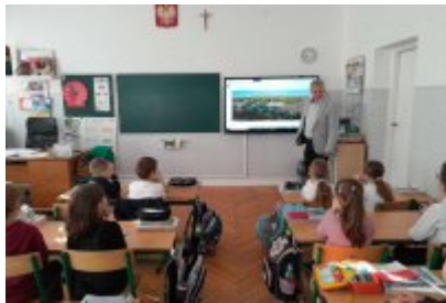
Zajęcia edukacyjne ekodoradcy w SP2