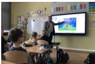
Zajęcia ekodoradcy w SP5