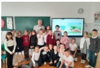
Zajęcia edukacyjne ekodoradcy w SP2