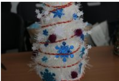
• Świąteczne warsztaty rękodzieła (28.11.2023)