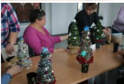
• Świąteczne warsztaty rękodzieła (28.11.2023)