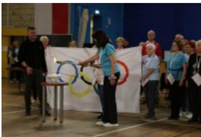
III Czeladzka Olimpiada Seniorów