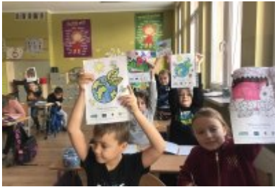
Zajęcia ekodoradcy w SP5