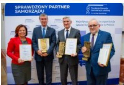
Ranking Gmin Województwa Śląskiego 2023