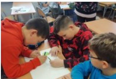
Kolejne zajęcia o smogu