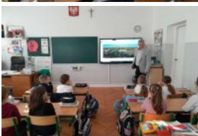
Zajęcia edukacyjne ekodoradcy w SP2