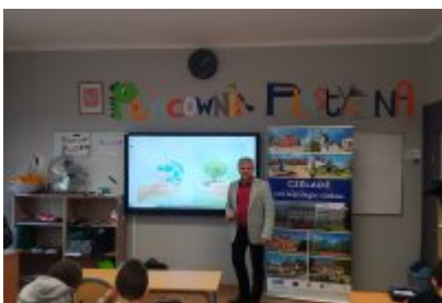
Kolejne zajęcia o smogu