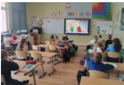
Zajęcia ekodoradcy w SP5