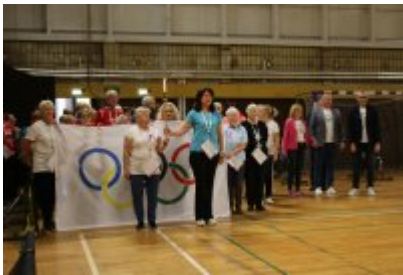
III Czeladzka Olimpiada Seniorów