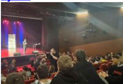
Profilaktyczne spotkanie dla uczniów „Nie Zmarnuj Swojego Życia”