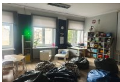
• Szkoła Podstawowa nr 7