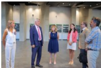
• Umowa z Adventure Multimedialne Muzea podpisana