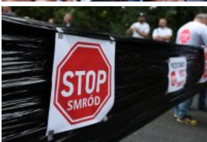
• Protest mieszkańców w sprawie uciążliwego zapachu