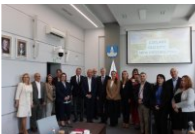
• Wizyta delegacji z Malty w Czeladzi