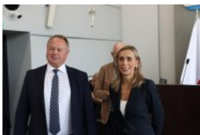
Wizyta delegacji z Malty w Czeladzi