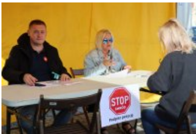
Piknik Ekologiczny w Czeladzi