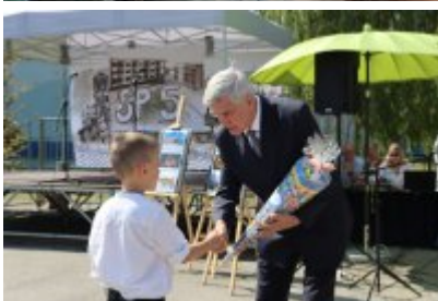
Miejskie Rozpoczęcie Roku Szkolnego 2024/2025