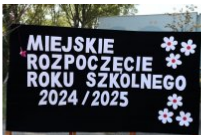
• Miejskie Rozpoczęcie Roku Szkolnego 2024/2025