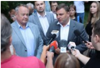
• Protest mieszkańców w sprawie uciążliwego zapachu