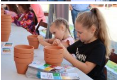
Piknik Ekologiczny w Czeladzi