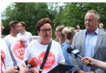
• Protest mieszkańców w sprawie uciążliwego zapachu