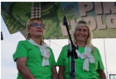
Piknik Ekologiczny w Czeladzi