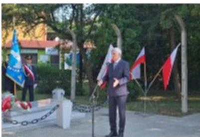
85. rocznica wybuchu II wojny światowej