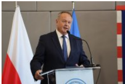
Pasowanie klas pierwszych w ZSOiT w Czeladzi