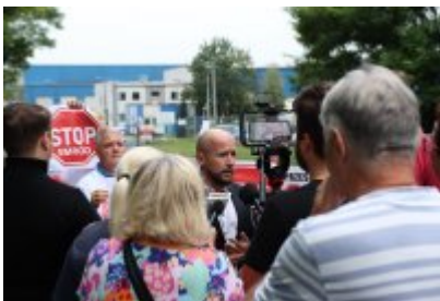
• Protest mieszkańców w sprawie uciążliwego zapachu