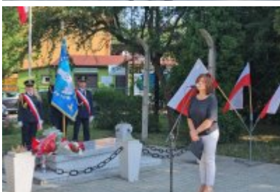
85. rocznica wybuchu II wojny światowej