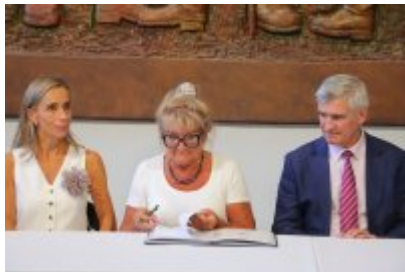
• Umowa z Adventure Multimedialne Muzea podpisana