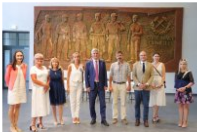
• Umowa z Adventure Multimedialne Muzea podpisana