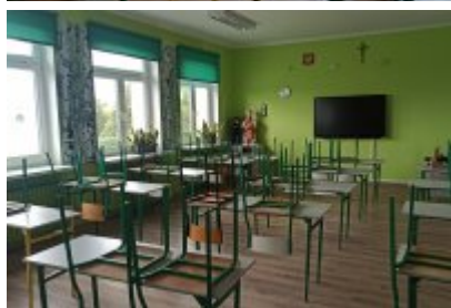
• Szkoła Podstawowa nr 7