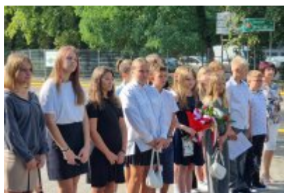
• 85. rocznica wybuchu II wojny światowej