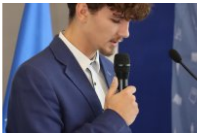
Pasowanie klas pierwszych w ZSOiT w Czeladzi