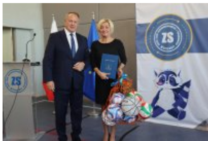
Pasowanie klas pierwszych w ZSOiT w Czeladzi