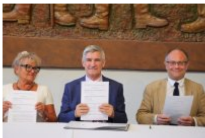
• Umowa z Adventure Multimedialne Muzea podpisana