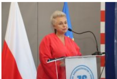
Pasowanie klas pierwszych w ZSOiT w Czeladzi