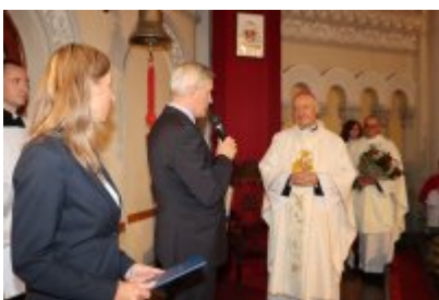
• Diecezjalny Dzień Chorych