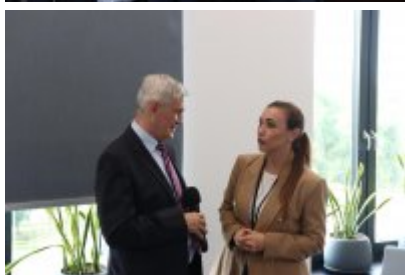
Wizyta delegacji z Malty w Czeladzi