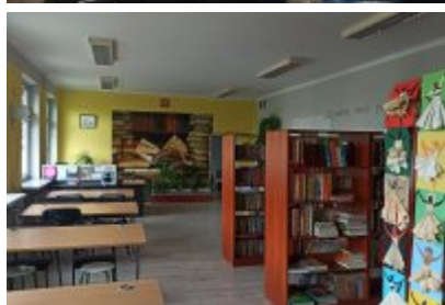
• Szkoła Podstawowa nr 7