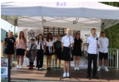
Miejskie Rozpoczęcie Roku Szkolnego 2024/2025