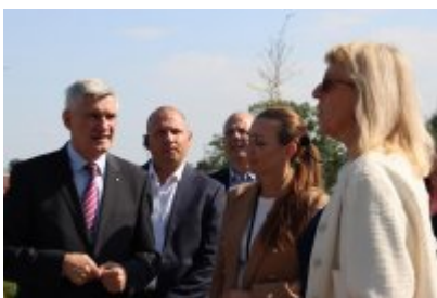
• Wizyta delegacji z Malty w Czeladzi