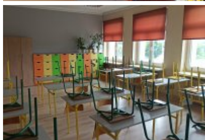
• Szkoła Podstawowa nr 7