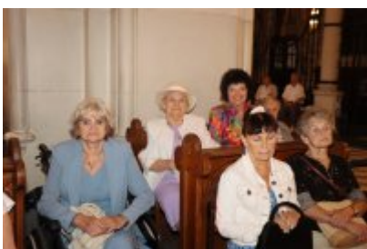
• Diecezjalny Dzień Chorych