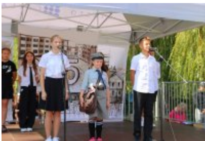
Miejskie Rozpoczęcie Roku Szkolnego 2024/2025