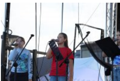
Piknik Ekologiczny w Czeladzi