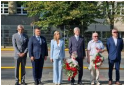
85. rocznica wybuchu II wojny światowej