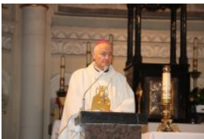
• Diecezjalny Dzień Chorych