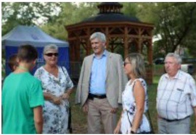
• Wakacyjny koncert na Jordanie (25.08.2024)