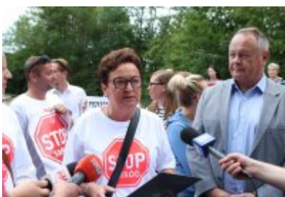
• Protest mieszkańców w sprawie uciążliwego zapachu