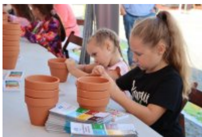
Piknik Ekologiczny w Czeladzi