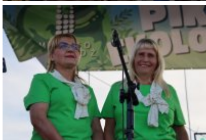
Piknik Ekologiczny w Czeladzi