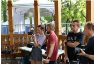
• Wakacyjny koncert na Jordanie (25.08.2024)