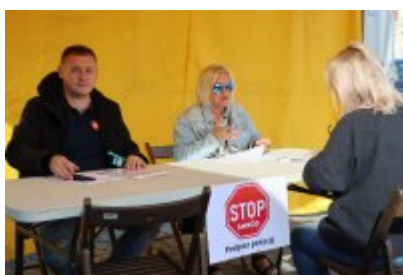
Piknik Ekologiczny w Czeladzi