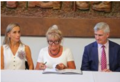
• Umowa z Adventure Multimedialne Muzea podpisana