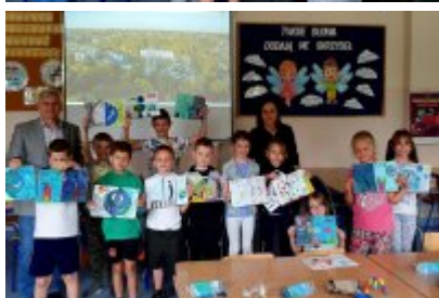
O smogu i ekologii z uczniami