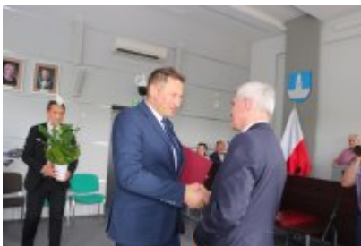
Pierwsza sesja Rady Miejskiej w Czeladzi w kadencji 2024-2029