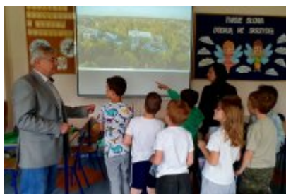
O smogu i ekologii z uczniami