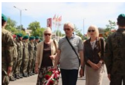
80. rocznica bitwy o Monte Cassino