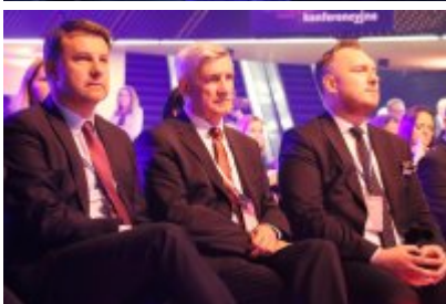
Gala Top Inwestycje Komunalne 2024