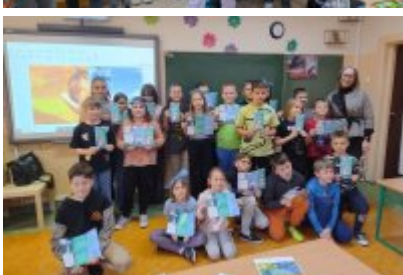
Zajęcia ekologiczne z ekodoradcą