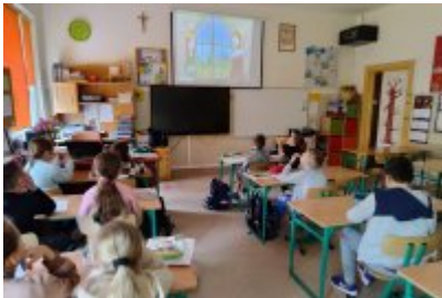
Zajęcia ekologiczne z ekodoradcą