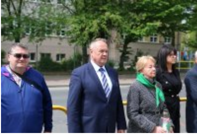
• 79. rocznica zakończenia II wojny światowej