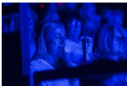
XXV Festiwal Ave - Kopalnia Kultury