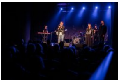
XXV Festiwal Ave - Kopalnia Kultury