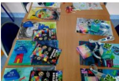
O smogu i ekologii z uczniami