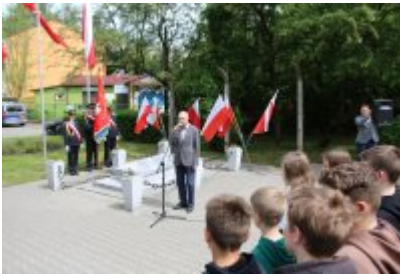
• 79. rocznica zakończenia II wojny światowej