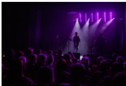
XXV Festiwal Ave - Kopalnia Kultury