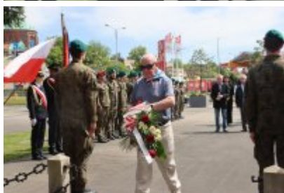
80. rocznica bitwy o Monte Cassino