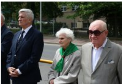
• 79. rocznica zakończenia II wojny światowej