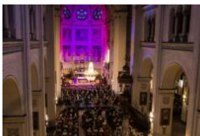
XXV Festiwal Ave - kościół św. Stanisława