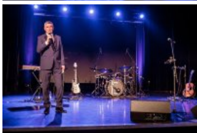
XXV Festiwal Ave - Kopalnia Kultury