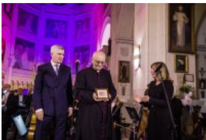
• XXV Festiwal Ave - kościół św. Stanisława