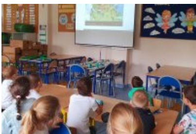
O smogu i ekologii z uczniami