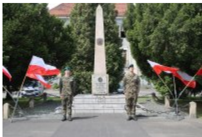
80. rocznica bitwy o Monte Cassino