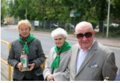
• 79. rocznica zakończenia II wojny światowej