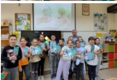
Zajęcia ekologiczne z ekodoradcą