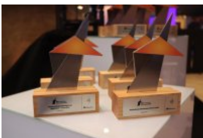
Gala Top Inwestycje Komunalne 2024