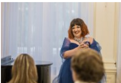
• XXV Festiwal Ave - Muzeum Saturn