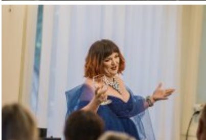
• XXV Festiwal Ave - Muzeum Saturn