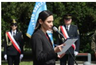
80. rocznica bitwy o Monte Cassino