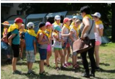
• Rozpoczęcie II turnusu Nieobozowej Akcji Lato