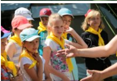
• Rozpoczęcie II turnusu Nieobozowej Akcji Lato