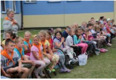
Zakończenie Nieobozowej Akcji Lato