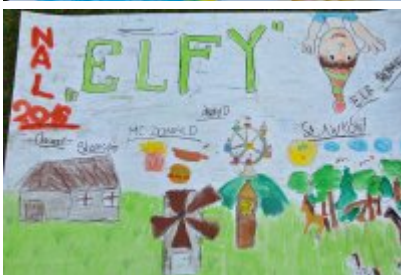
• Zakończenie II turnusu Nieobozowej Akcji Lato