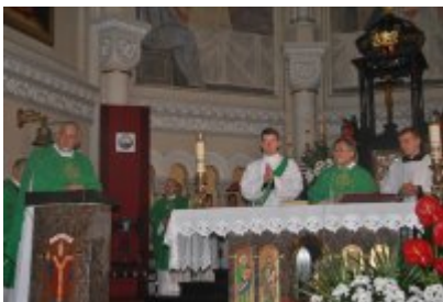
• Światowe Dni Młodzieży