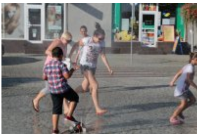
• Pożegnanie wakacji