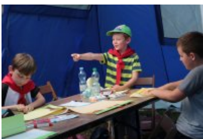
• Rozpoczęcie II turnusu Nieobozowej Akcji Lato