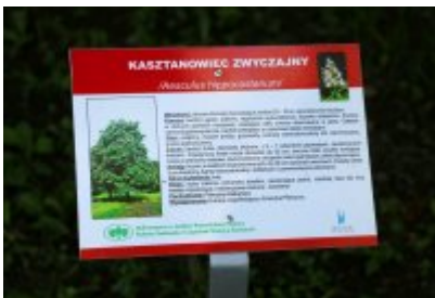
• Ścieżka przyrodniczo-dydaktyczna w Parku Kościuszki