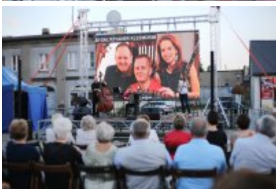
• Szalom na Rynku