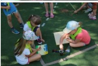
• Rozpoczęcie II turnusu Nieobozowej Akcji Lato