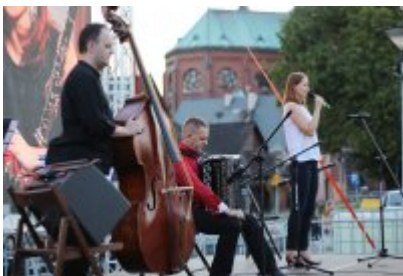
• Szalom na Rynku