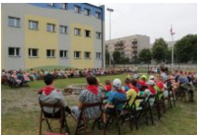
Zakończenie Nieobozowej Akcji Lato