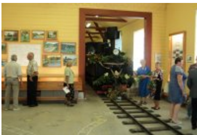
• Urodziny kolei wąskotorowej