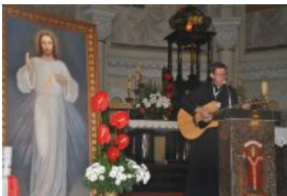
• Światowe Dni Młodzieży