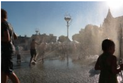
• Pożegnanie wakacji