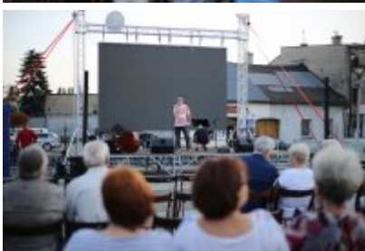
• Szalom na Rynku