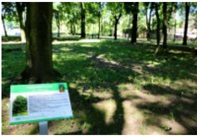
• Ścieżka przyrodniczo-dydaktyczna w Parku Kościuszki