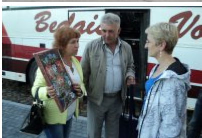
• Miasto Czeladź otrzymuje prezent od delegacji z Białorusi