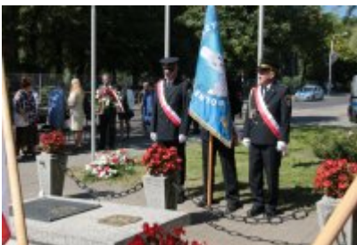
Rocznica wybuchu II Wojny Światowej