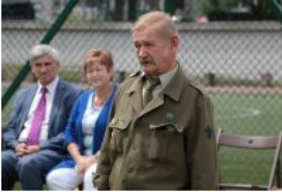
Zakończenie Nieobozowej Akcji Lato