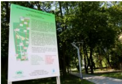
• Ścieżka przyrodniczo-dydaktyczna w Parku Kościuszki