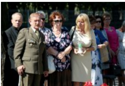
• Rocznica wybuchu II Wojny Światowej