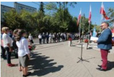
Rocznica wybuchu II Wojny Światowej