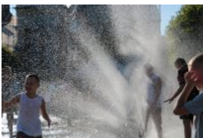
• Pożegnanie wakacji