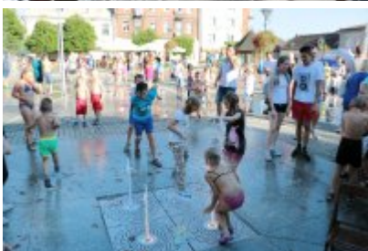
• Pożegnanie wakacji