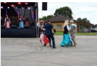
• Święto miasta