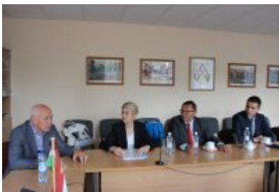
• Wizyta w merostwie_3