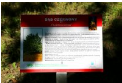
Ścieżka przyrodniczo-dydaktyczna w Parku Kościuszki