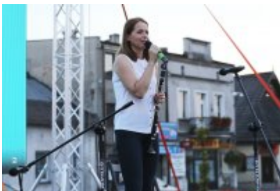
• Szalom na Rynku