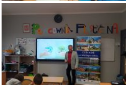
• Kolejne zajęcia o smogu