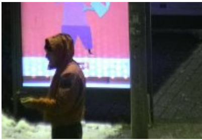
• Dewastacja Wiaty