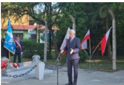
85. rocznica wybuchu II wojny światowej