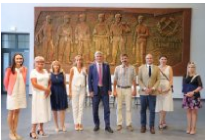
Umowa z Adventure Multimedialne Muzea podpisana