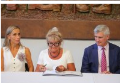
Umowa z Adventure Multimedialne Muzea podpisana