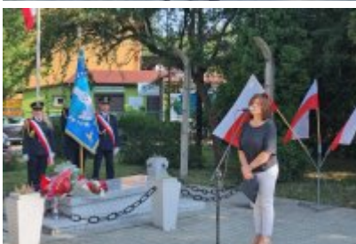
85. rocznica wybuchu II wojny światowej