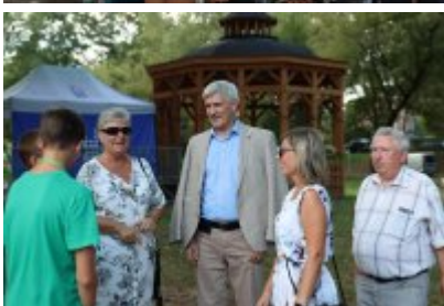
• Wakacyjny koncert na Jordanie (25.08.2024)