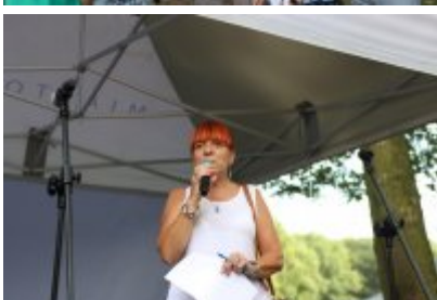
• Wakacyjny koncert na Jordanie (25.08.2024)