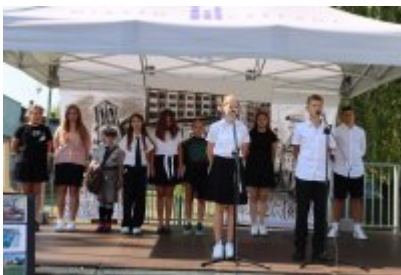
Miejskie Rozpoczęcie Roku Szkolnego 2024/2025