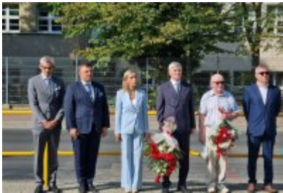
85. rocznica wybuchu II wojny światowej