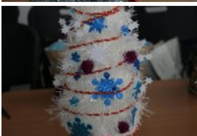
• Świąteczne warsztaty rękodzieła (28.11.2023)