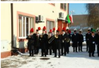
• Barbórka 2023 w Czeladzi