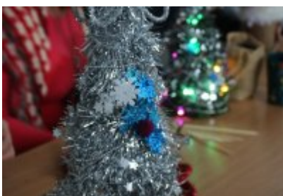
• Świąteczne warsztaty rękodzieła (28.11.2023)