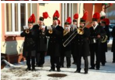
• Barbórka 2023 w Czeladzi