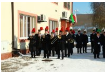
• Barbórka 2023 w Czeladzi