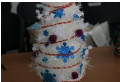
• Świąteczne warsztaty rękodzieła (28.11.2023)