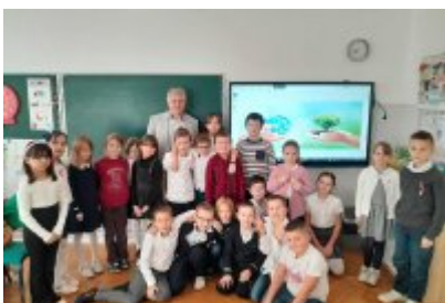
Zajęcia edukacyjne ekodoradcy w SP2