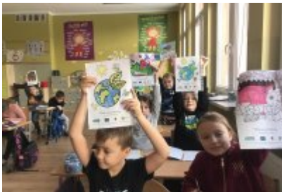
Zajęcia ekodoradcy w SP5