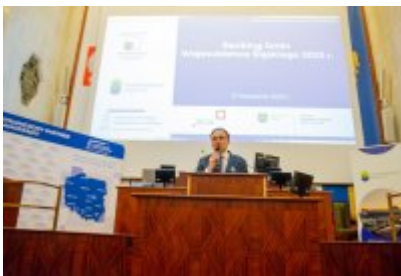
Ranking Gmin Województwa Śląskiego 2023