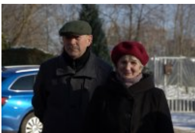
• Odświeżenie tablicy upamiętniającej Stanisława Boguckiego