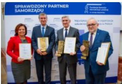
Ranking Gmin Województwa Śląskiego 2023