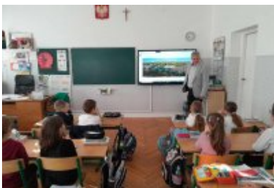
Zajęcia edukacyjne ekodoradcy w SP2