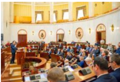
Ranking Gmin Województwa Śląskiego 2023