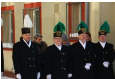
• Barbórka 2023 w Czeladzi