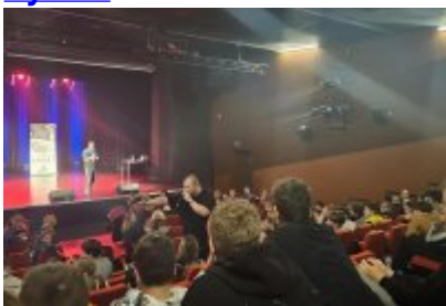
Profilaktyczne spotkanie dla uczniów „Nie Zmarnuj Swojego Życia”