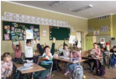
Zajęcia ekodoradcy w SP5