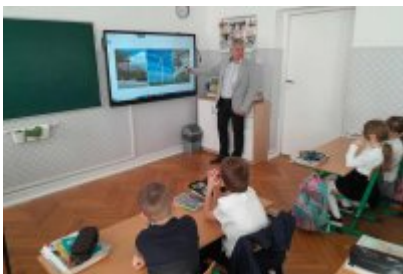
Zajęcia edukacyjne ekodoradcy w SP2