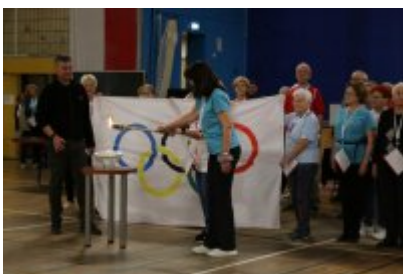
• III Czeladzka Olimpiada Seniorów