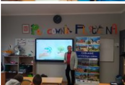
• Kolejne zajęcia o smogu