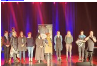
Profilaktyczne spotkanie dla uczniów „Nie Zmarnuj Swojego Życia”