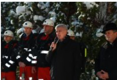
• Barbórka 2023 w Czeladzi