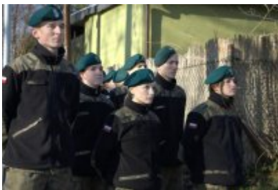
• Odświeżenie tablicy upamiętniającej Stanisława Boguckiego