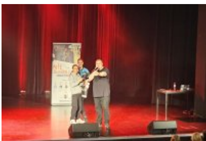
Profilaktyczne spotkanie dla uczniów „Nie Zmarnuj Swojego Życia”