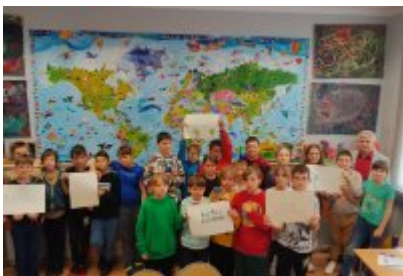
Kolejne zajęcia o smogu