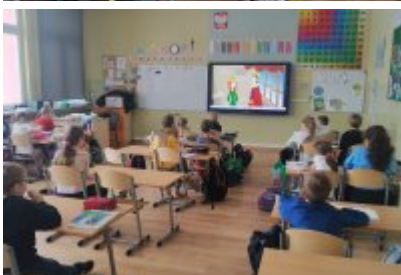
Zajęcia ekodoradcy w SP5