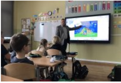
Zajęcia ekodoradcy w SP5