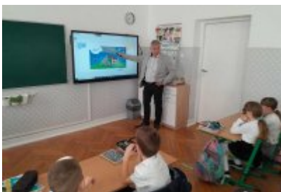
Zajęcia edukacyjne ekodoradcy w SP2