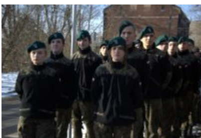
• Odświeżenie tablicy upamiętniającej Stanisława Boguckiego