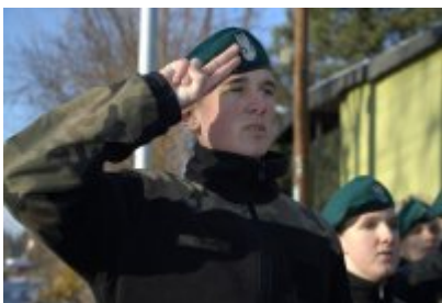
• Odświeżenie tablicy upamiętniającej Stanisława Boguckiego