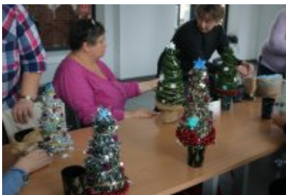
• Świąteczne warsztaty rękodzieła (28.11.2023)