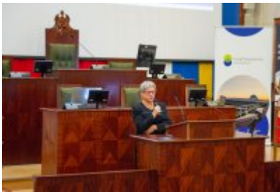
Ranking Gmin Województwa Śląskiego 2023