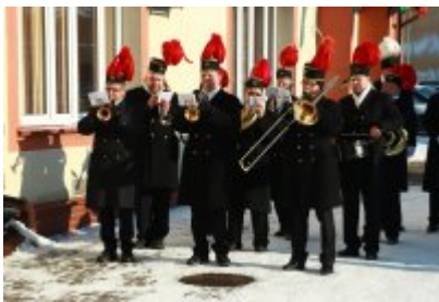
• Barbórka 2023 w Czeladzi