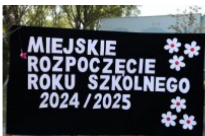
• Miejskie Rozpoczęcie Roku Szkolnego 2024/2025