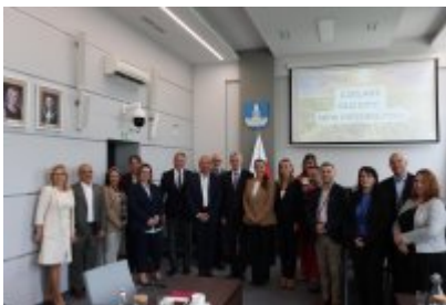
• Wizyta delegacji z Malty w Czeladzi