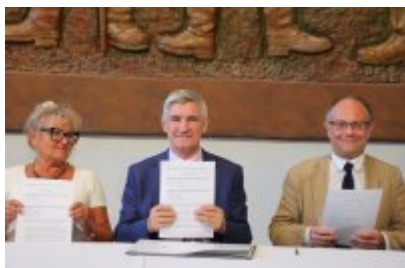
• Umowa z Adventure Multimedialne Muzea podpisana