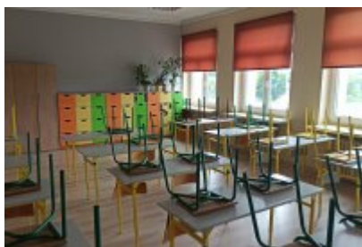
• Szkoła Podstawowa nr 7