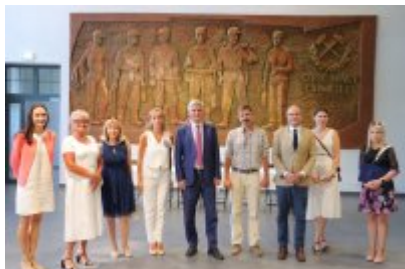
• Umowa z Adventure Multimedialne Muzea podpisana