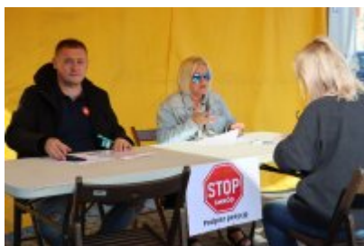
Piknik Ekologiczny w Czeladzi