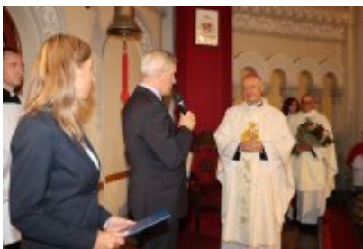
• Diecezjalny Dzień Chorych