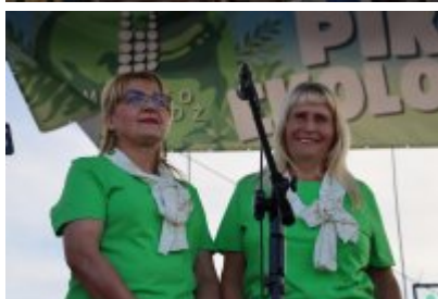
Piknik Ekologiczny w Czeladzi