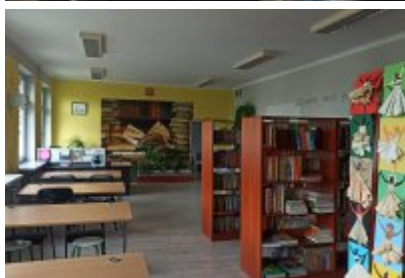
• Szkoła Podstawowa nr 7