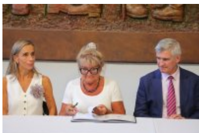
• Umowa z Adventure Multimedialne Muzea podpisana