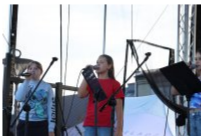
Piknik Ekologiczny w Czeladzi