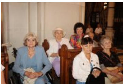
• Diecezjalny Dzień Chorych