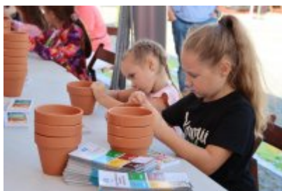
Piknik Ekologiczny w Czeladzi