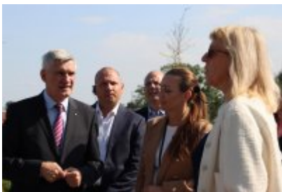
• Wizyta delegacji z Malty w Czeladzi