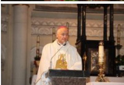
• Diecezjalny Dzień Chorych