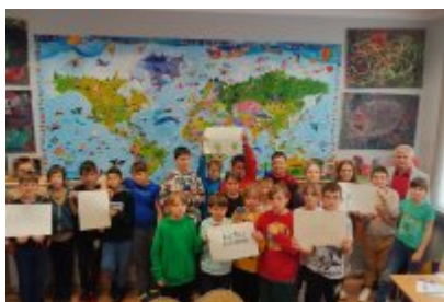
Kolejne zajęcia o smogu