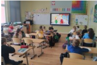
Zajęcia ekodoradcy w SP5