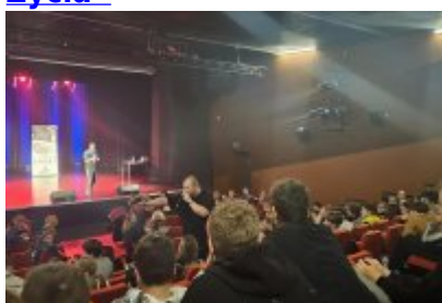
Profilaktyczne spotkanie dla uczniów „Nie Zmarnuj Swojego Życia”