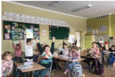
Zajęcia ekodoradcy w SP5