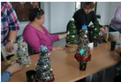
• Świąteczne warsztaty rękodzieła (28.11.2023)