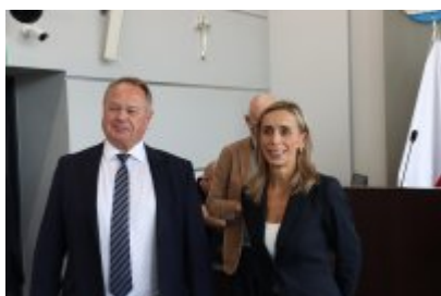
Wizyta delegacji z Malty w Czeladzi