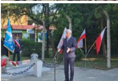
85. rocznica wybuchu II wojny światowej