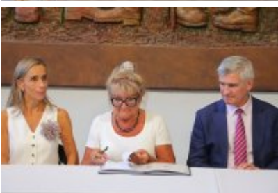
• Umowa z Adventure Multimedialne Muzea podpisana