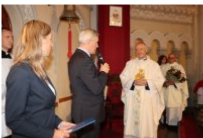
• Diecezjalny Dzień Chorych