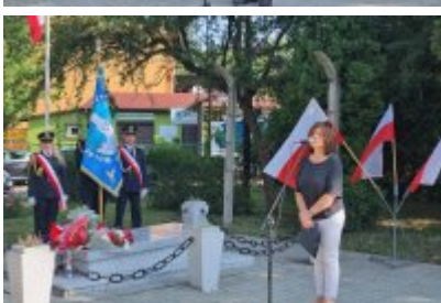
85. rocznica wybuchu II wojny światowej