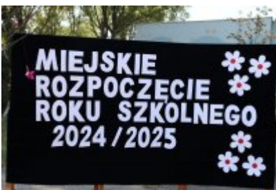
• Miejskie Rozpoczęcie Roku Szkolnego 2024/2025