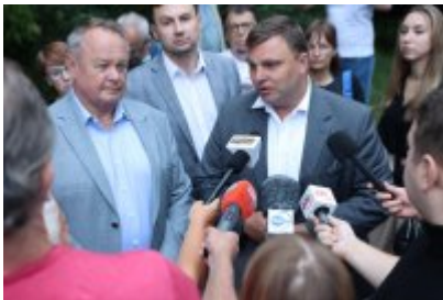
• Protest mieszkańców w sprawie uciążliwego zapachu