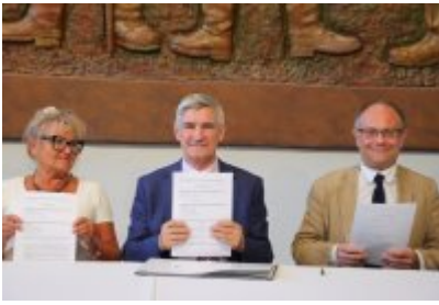
• Umowa z Adventure Multimedialne Muzea podpisana