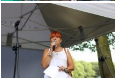
• Wakacyjny koncert na Jordanie (25.08.2024)