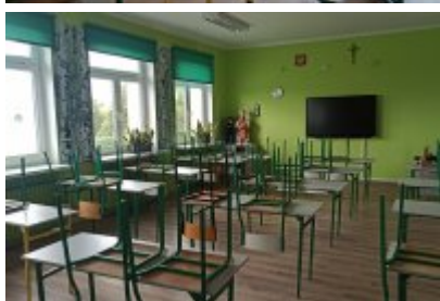
• Szkoła Podstawowa nr 7