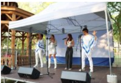
• Wakacyjny koncert na Jordanie (25.08.2024)