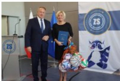
Pasowanie klas pierwszych w ZSOiT w Czeladzi