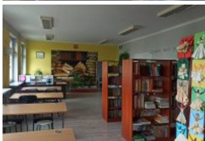
• Szkoła Podstawowa nr 7