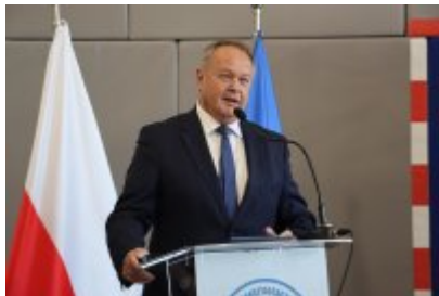
Pasowanie klas pierwszych w ZSOiT w Czeladzi