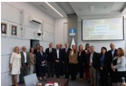
• Wizyta delegacji z Malty w Czeladzi