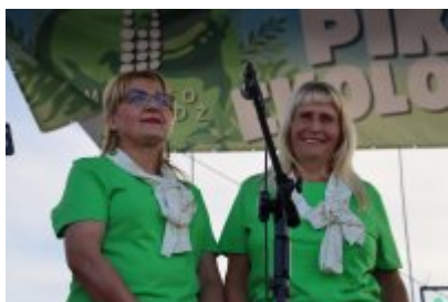
Piknik Ekologiczny w Czeladzi