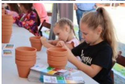
Piknik Ekologiczny w Czeladzi