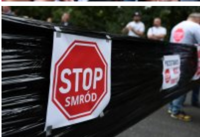
• Protest mieszkańców w sprawie uciążliwego zapachu