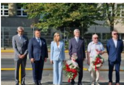
85. rocznica wybuchu II wojny światowej