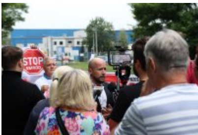
• Protest mieszkańców w sprawie uciążliwego zapachu