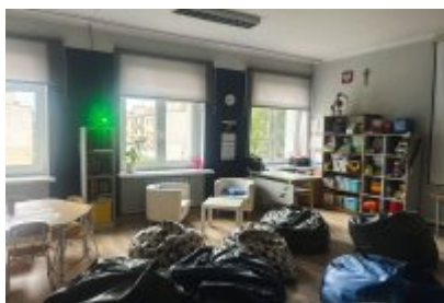
• Szkoła Podstawowa nr 7