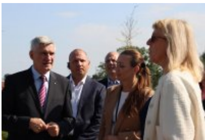
• Wizyta delegacji z Malty w Czeladzi