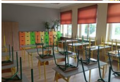
• Szkoła Podstawowa nr 7