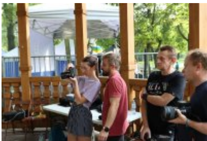
• Wakacyjny koncert na Jordanie (25.08.2024)