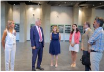
• Umowa z Adventure Multimedialne Muzea podpisana