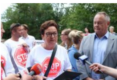
• Protest mieszkańców w sprawie uciążliwego zapachu