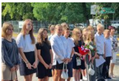
• 85. rocznica wybuchu II wojny światowej