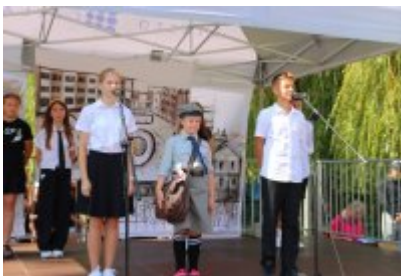
Miejskie Rozpoczęcie Roku Szkolnego 2024/2025