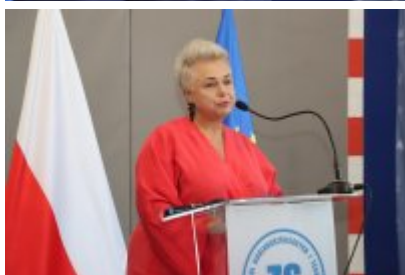
Pasowanie klas pierwszych w ZSOiT w Czeladzi