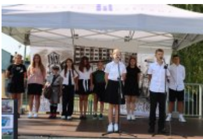
Miejskie Rozpoczęcie Roku Szkolnego 2024/2025