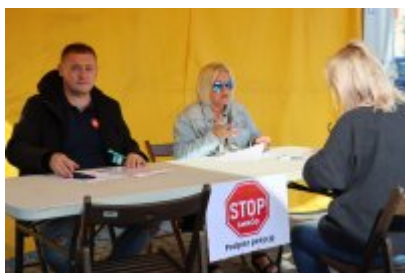
Piknik Ekologiczny w Czeladzi