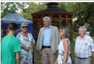
• Wakacyjny koncert na Jordanie (25.08.2024)