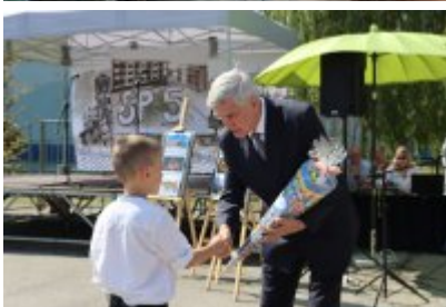
Miejskie Rozpoczęcie Roku Szkolnego 2024/2025