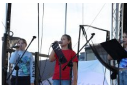
Piknik Ekologiczny w Czeladzi