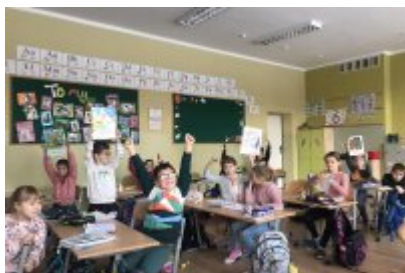
• Zajęcia ekodoradcy w SP5