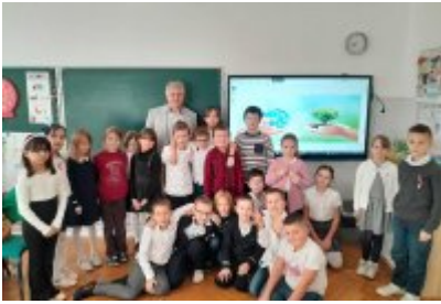
Zajęcia edukacyjne ekodoradcy w SP2