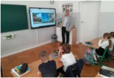
Zajęcia edukacyjne ekodoradcy w SP2