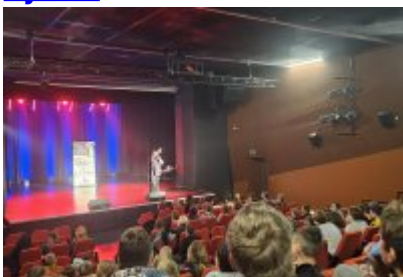
Profilaktyczne spotkanie dla uczniów „Nie Zmarnuj Swojego Życia”