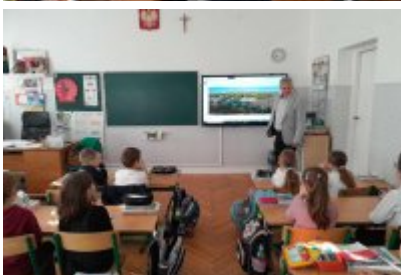
Zajęcia edukacyjne ekodoradcy w SP2