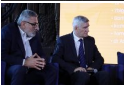
Booster dla Biznesu w Czeladzi