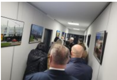
• Wizyta samorządowców z Dolnego Śląska w Czeladzi