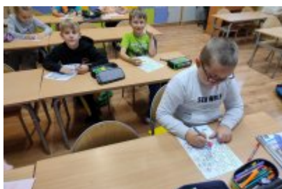
Zajęcia ekologiczne w SP4