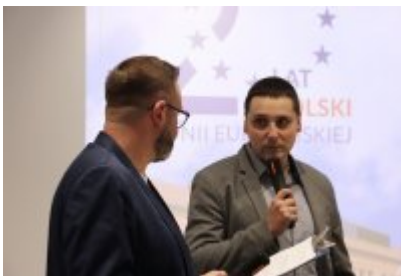
Konferencja prasowa na temat komiksu z czeladzką Cechownią