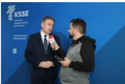
Podpisanie porozumienia z KSSE