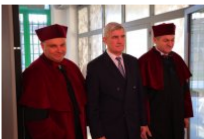
• Inauguracja 16. roku akademickiego UTW