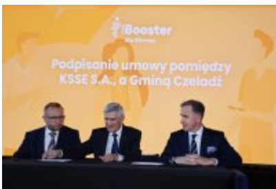
Booster dla Biznesu w Czeladzi