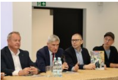
Konferencja prasowa na temat komiksu z czeladzką Cechownią w tle