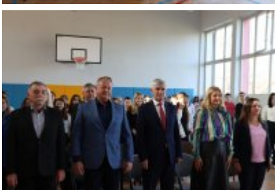
• Otwarcie wyremontowanej sali gimnastycznej w SP5