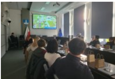
• Wizyta samorządowców z Dolnego Śląska w Czeladzi