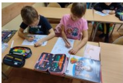
Zajęcia ekologiczne w SP4