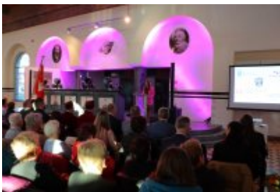
Inauguracja 16. roku akademickiego UTW