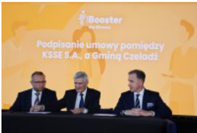
Podpisanie porozumienia z KSSE