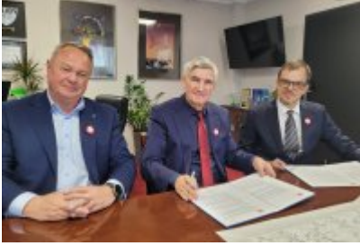
Miasto Czeladź wspiera Szlachetną Paczkę