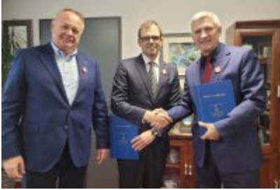
Miasto Czeladź wspiera Szlachetną Paczkę