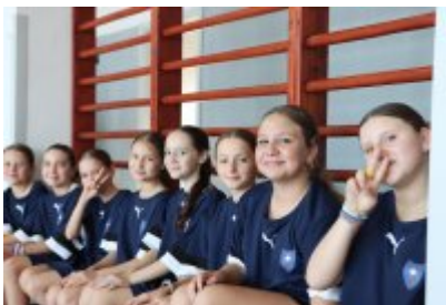
• Otwarcie wyremontowanej sali gimnastycznej w SP5