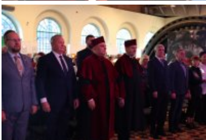
• Inauguracja 16. roku akademickiego UTW