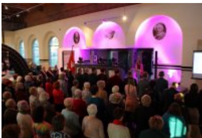
Inauguracja 16. roku akademickiego UTW