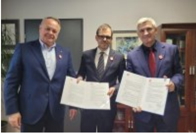
Miasto Czeladź wspiera Szlachetną Paczkę