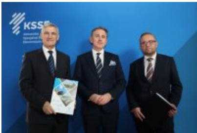
Podpisanie porozumienia z KSSE