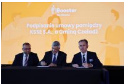
Podpisanie porozumienia z KSSE