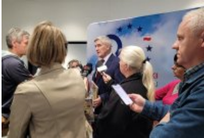
Konferencja prasowa na temat komiksu z czeladzką Cechownią