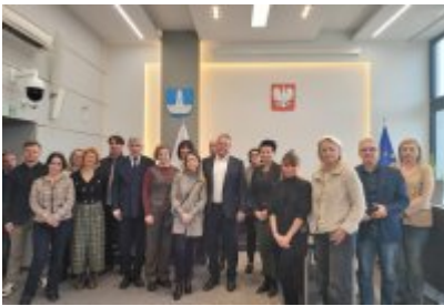
Wizyta samorządowców z Dolnego Śląska w Czeladzi