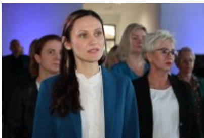
• Wojewódzka inauguracja roku sportowego