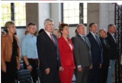
• Wojewódzka inauguracja roku sportowego