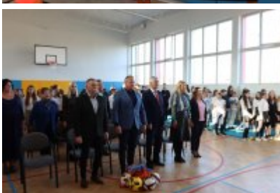
• Otwarcie wyremontowanej sali gimnastycznej w SP5