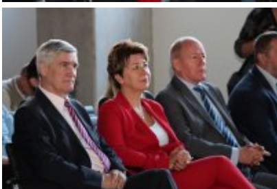
• Wojewódzka inauguracja roku sportowego