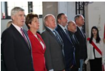
• Wojewódzka inauguracja roku sportowego