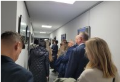
Wizyta samorządowców z Dolnego Śląska w Czeladzi