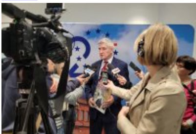
Konferencja prasowa na temat komiksu z czeladzką Cechownią