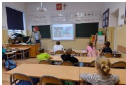
Zajęcia ekologiczne w SP4