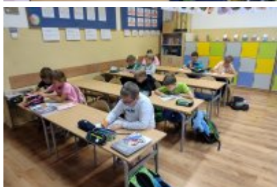
Zajęcia ekologiczne w SP4