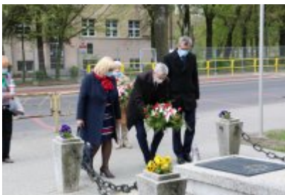
• 8 maja - Zakończenie II wojny światowej