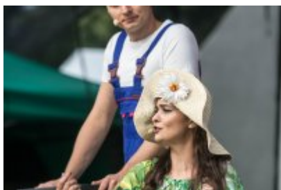
Dni Czeladzi 2021