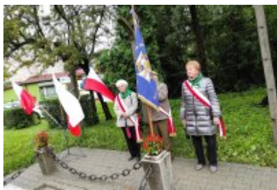
82. rocznica wybuchu II wojny światowej