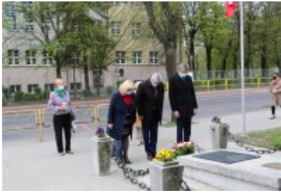
• 8 maja - Zakończenie II wojny światowej