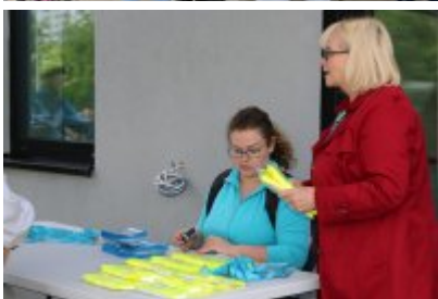
• Otwarcie Dworca w Czeladzi