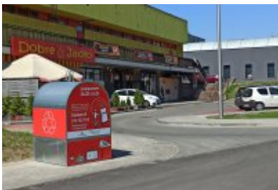
• Czerwone pojemniki