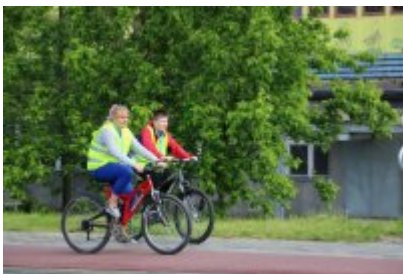
• Otwarcie Dworca w Czeladzi