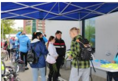
• Otwarcie Dworca w Czeladzi