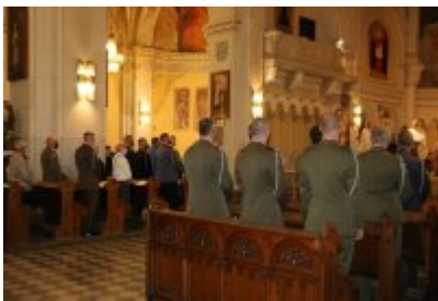
• Dzień Weterana Działań poza Granicami Państwa