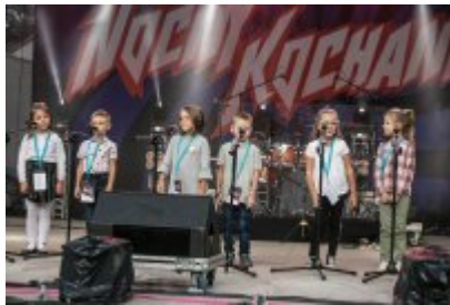
Dni Czeladzi 2021