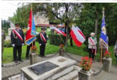
82. rocznica wybuchu II wojny światowej