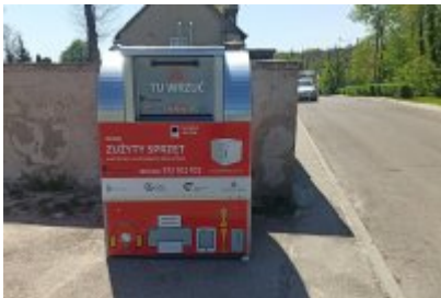
• Czerwone pojemniki