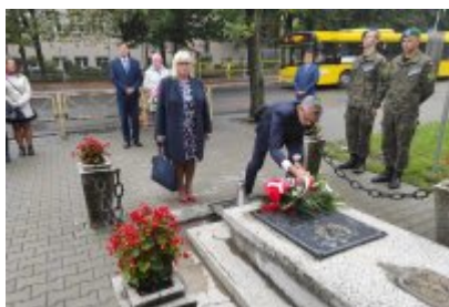
82. rocznica wybuchu II wojny światowej