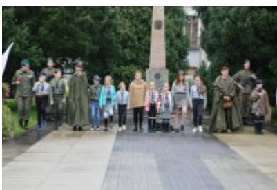
Uroczyste ślubowanie klas mundurowych