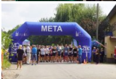
Bieg Lato 2021