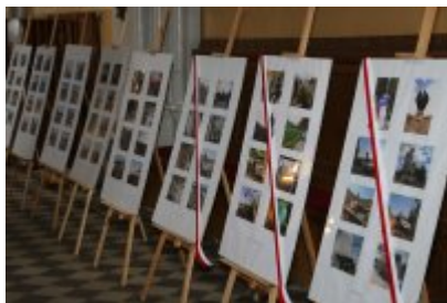
Dzień Weterana Działań poza Granicami Państwa