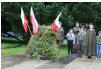
Uroczyste ślubowanie klas mundurowych