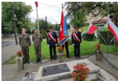
82. rocznica wybuchu II wojny światowej