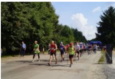
Bieg Lato 2021