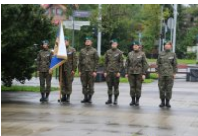
Uroczyste ślubowanie klas mundurowych