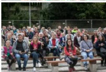
Dni Czeladzi 2021