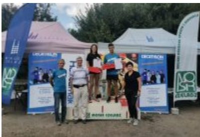
Bieg Lato 2021