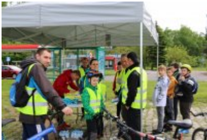
• Otwarcie Dworca w Czeladzi