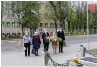
• 8 maja - Zakończenie II wojny światowej