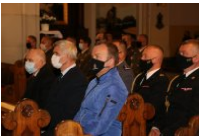
• Dzień Weterana Działań poza Granicami Państwa