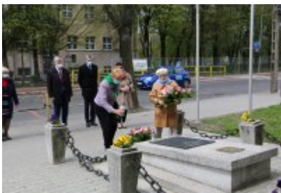
• 8 maja - Zakończenie II wojny światowej