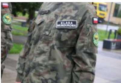
Uroczyste ślubowanie klas mundurowych