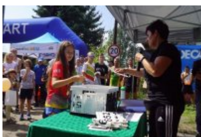
Bieg Lato 2021