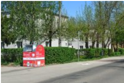
• Czerwone pojemniki