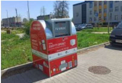
• Czerwone pojemniki