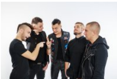
• Gwiazdy Dni Czeladzi 2020 - Nocny Kochanek