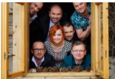
• Gwiazdy Dni Czeladzi 2020 - BRATHANKI