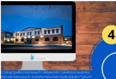
Wybierz inwestycję 30-lecia w Czeladzi

• Usług Społecznościowych i Aktywności Lokalnej w budynku ów mechanicznych i transformatorowej byłej kopalni "Saturn"