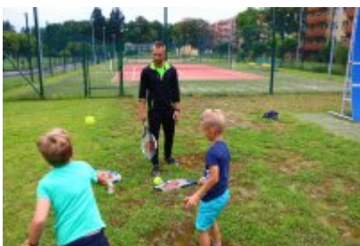
• Lato w mieście