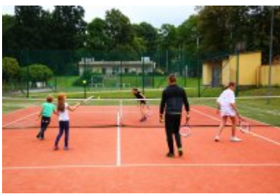
• Lato w mieście