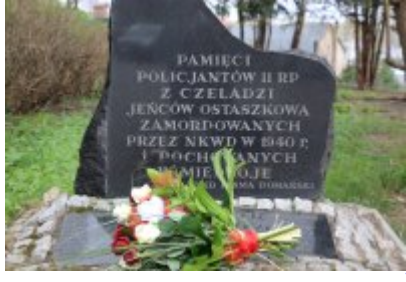
Czeladź pamięta o ofiarach Zbrodni Katyńskiej