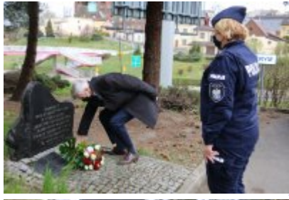
Czeladź pamięta o ofiarach Zbrodni Katyńskiej