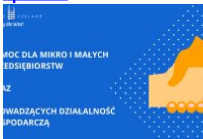
Działania Miasta Czeladź wspierające mieszkańców w czasie epidemii