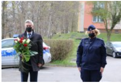
Czeladź pamięta o ofiarach Zbrodni Katyńskiej