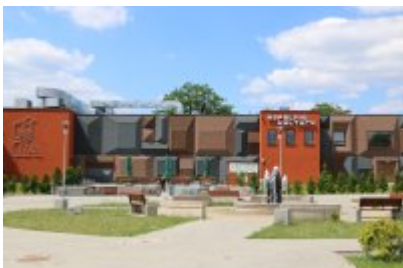
• Kopalnia Kultury w Czeladzi