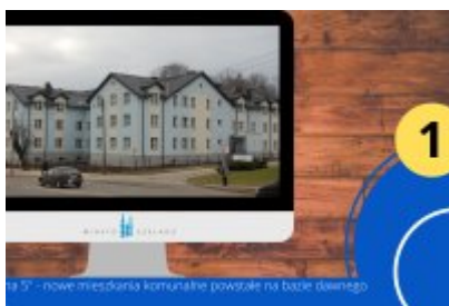
Wybierz inwestycję 30-lecia w Czeladzi