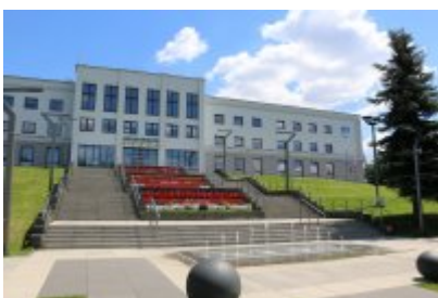
• Urząd Miasta 1