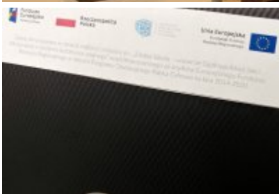
• Komputery dla czeladzkich uczniów