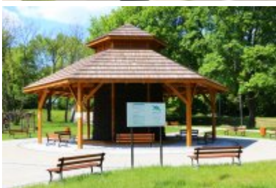
• Tężnia w Parku Grabek