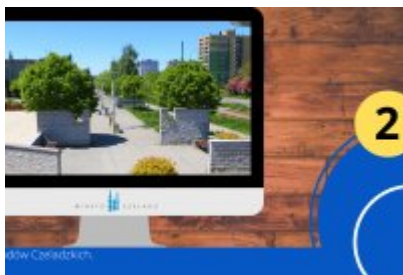
Wybierz inwestycję 30-lecia w Czeladzi