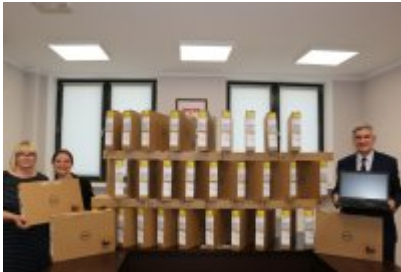
• Komputery dla czeladzkich uczniów