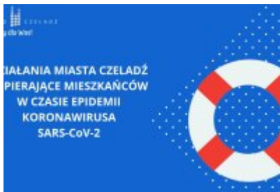
Działania Miasta Czeladź wspierające mieszkańców w czasie epidemii