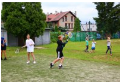
• Lato w mieście