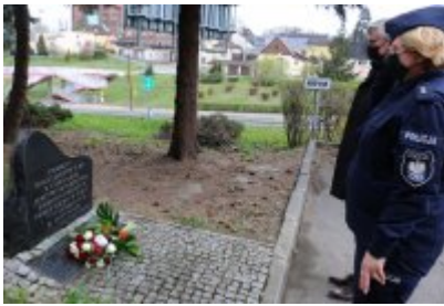
Czeladź pamięta o ofiarach Zbrodni Katyńskiej