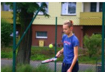
• Lato w mieście