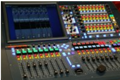
• Kopalnia Kultury sprzęt